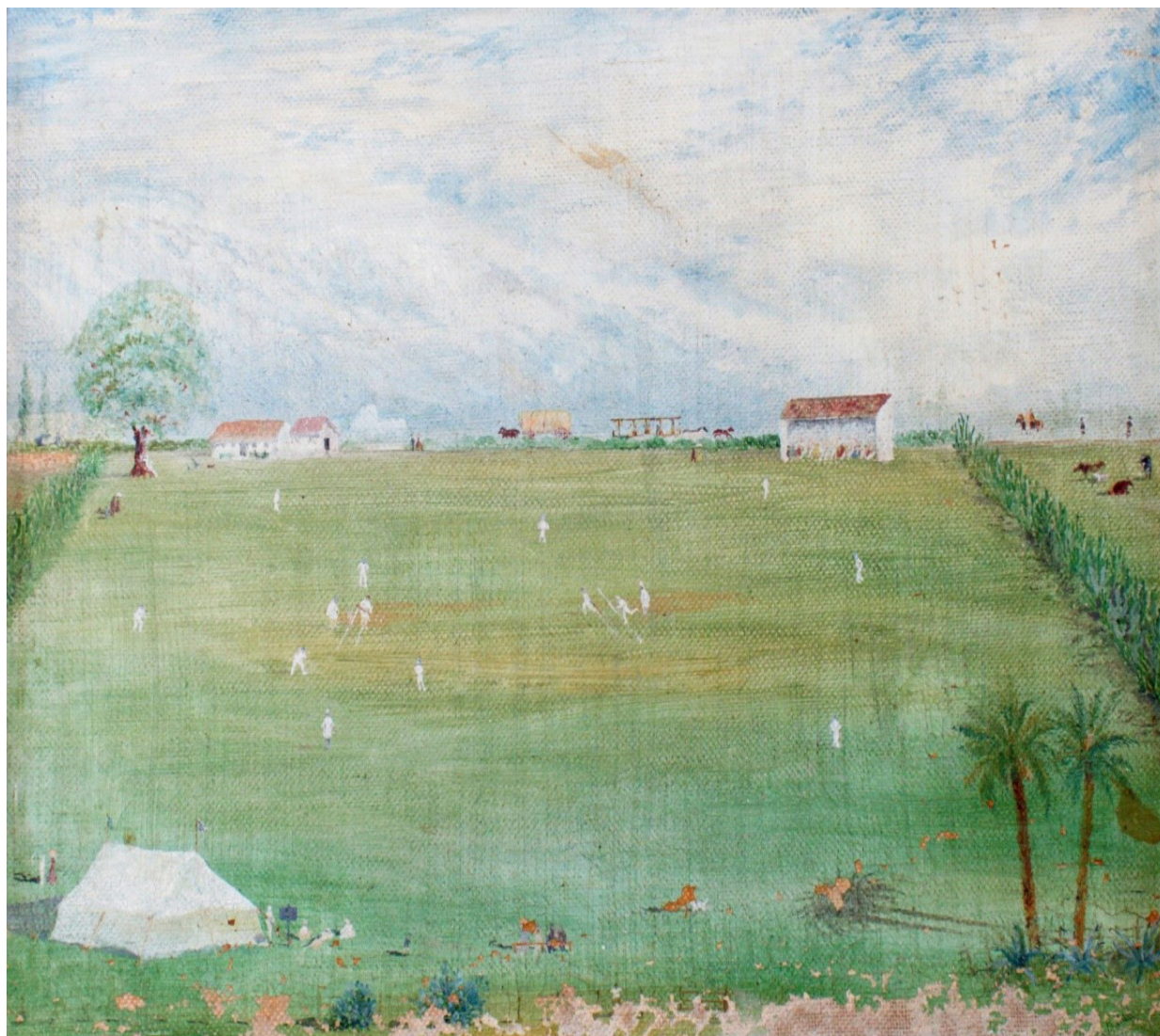
Figura 2. Óleo del Montevideo Cricket Club 1870-1880.

La perspectiva es la de un observador ubicado al centro del campo sobre lo que hoy es la Avenida Centenario, en el momento de una práctica o partido de cricket.