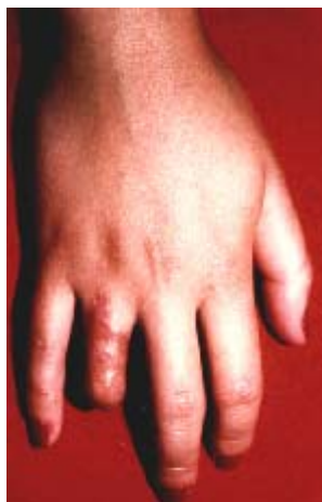
42A – Pérdida de dedo derecho