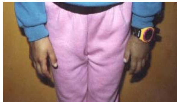
47D – Prótesis mano izquierda