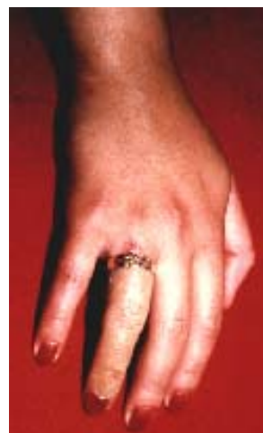
42D – Prótesis de dedo