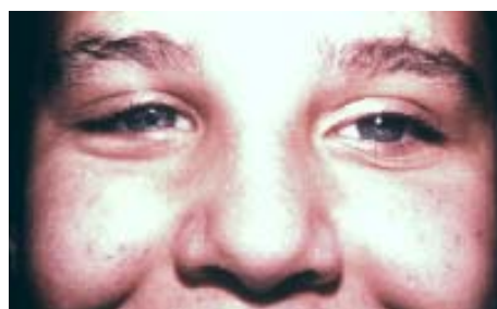
33D – Prótesis oculares izq. y der.