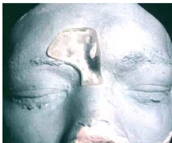
50D y A – Prótesis para corrección protético-quirúrgica sub cutánea