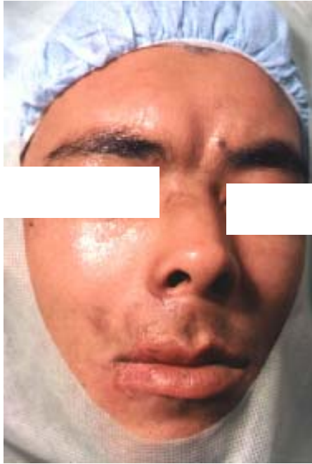
49A – Hundimiento del frontal