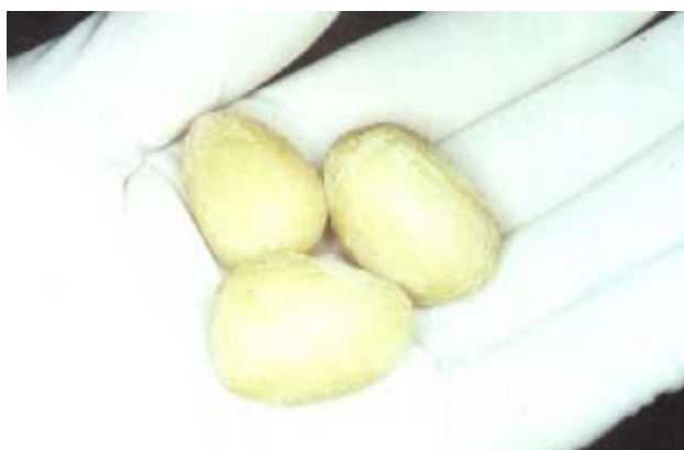
52D – Prótesis de testículo en silicón