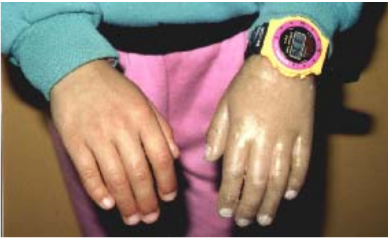
47A – Prótesis mano izquierda