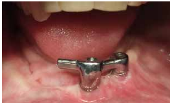
Figura 5. Barra para ferulización de los implantes.