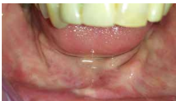
Figura 2. Situación clínica previa.