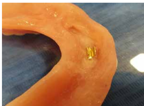
Figura 6. Prótesis removible soportada por clips (3i).