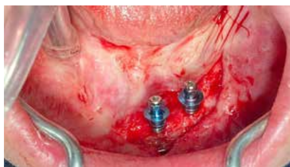
Figura 4. Colocación de implantes.

Bajo anestesia loco regional se realiza la intervención de colocación de implantes con protocolo de fresado convencional (figura 4). Completado el periodo de integración (4 meses) se realiza descubierta y colocación de tapas de cicatrización. Se confecciona una barra para ferulización de ambos implantes y la rehabilitación mediante prótesis removible soportada por clips (3i) (figuras 5 y 6).