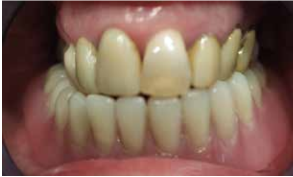
Figura 7. Frente estético al finalizar el tratamiento.

Una vez instalada la prótesis parcial removible se explica a la paciente el protocolo de mantenimiento recalcando la importancia de la higiene de la barra y demás elementos.