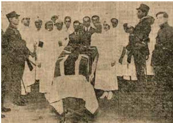
Figura 4. Personal diplomático, miembros de la tripulación y personal médico del Hospital Militar junto al féretro (2).

El personal de la guardia de honor (figura 3), viste el uniforme de Arma Montada. Al faltar más datos, se presume que los efectivos que se muestran en las fotografías pertenecen a Unidades que reciben la orden de ser parte de los Honores Fúnebres, siendo estas el Regimiento de Artillería N° 4, actual Grupo de Artillería 155mm N°5 o bien el Regimiento de Caballería N°4.