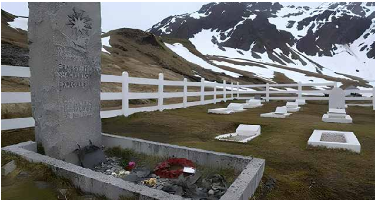
Figura 7. Tumba de Sir Ernest Shackleton en el cementerio Grytviken, Georgia del Sur (2).