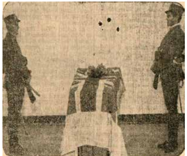
Figura 3. Féretro recibiendo Honores Fúnebres por personal militar (1).

Luego del embalsamamiento, el cuerpo pasaría a quedar en custodia en el Cementerio Inglés, situación que cambió con la noticia de la voluntad expresada por la viuda (5).