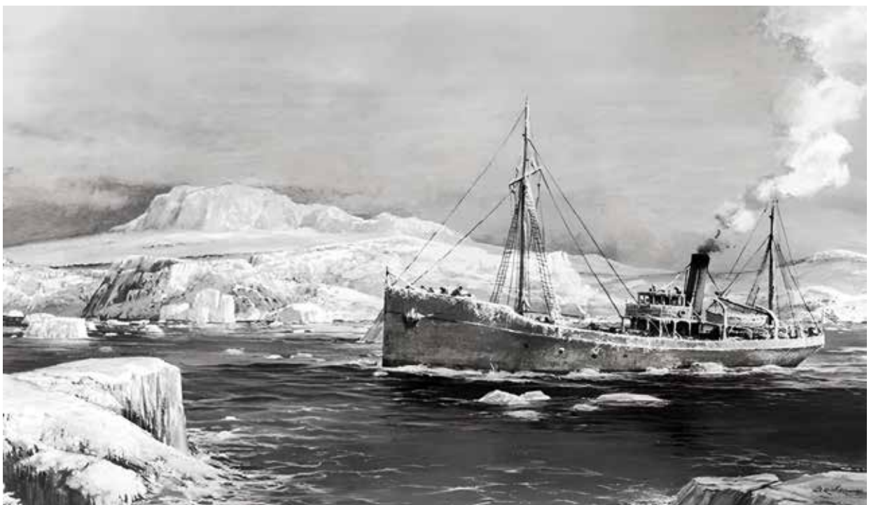
Figura 2. Buque Instituto de Pesca N°1 en el Círculo Antártico (3).

Luego de la certificación del deceso por parte de las autoridades locales, se realizó una autopsia con los materiales de que disponían y apuntando a la intención de mantener el cuerpo se le extrajeron las vísceras, se rellenaron las cavidades con lona embebida en formol, inyectándosele también dicho químico. Una vez amortajado, "los restos se encerraron herméticamente en un cajón de zinc galvani-