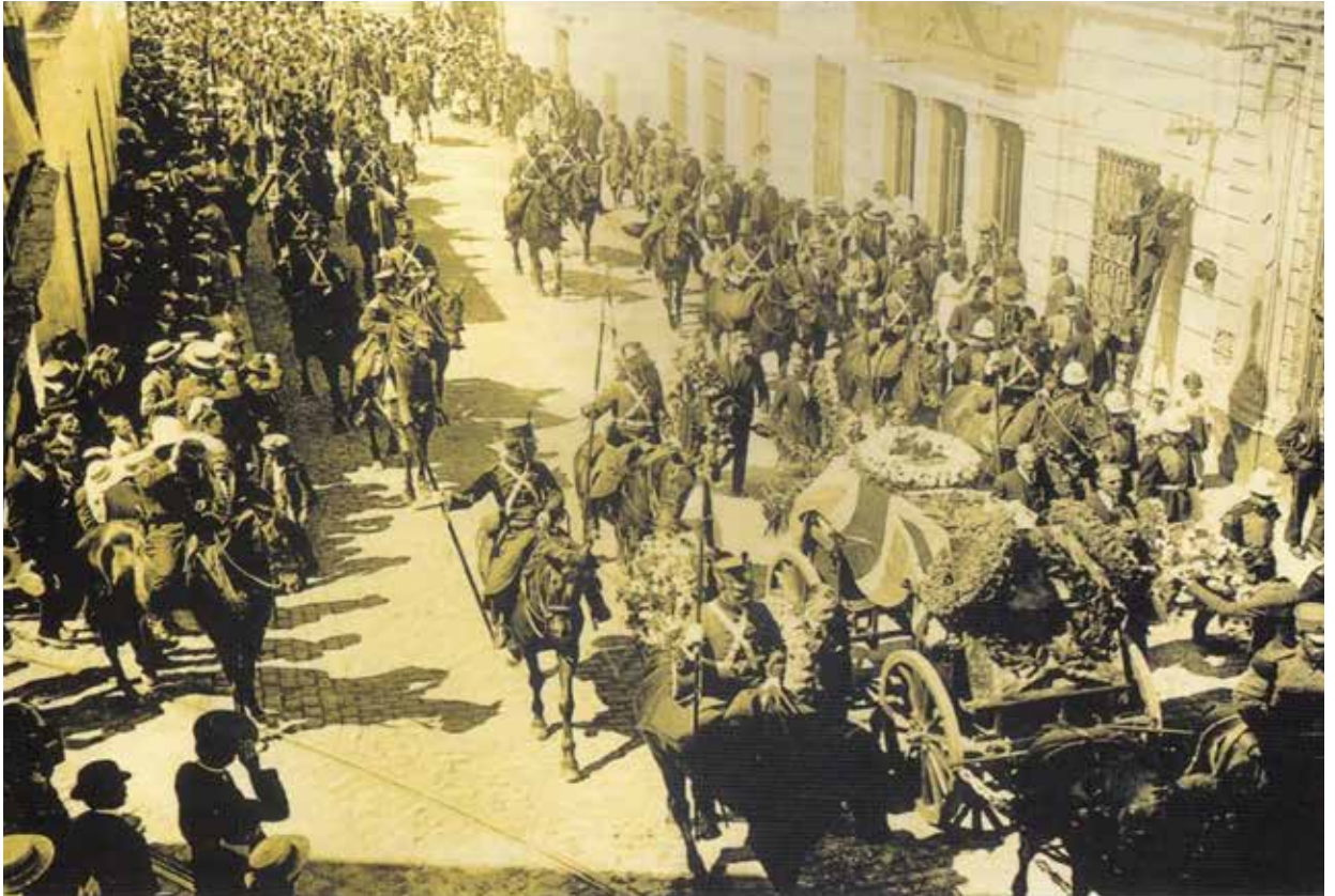
Figura 6. Cortejo fúnebre en la puerta del templo Inglés.

Llegados los restos, el lugar de descanso pasó a ser el Cementerio Grytviken, sito en la Isla San Pedro del archipiélago (figura 7).