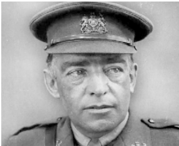
Figura 1. Sir Ernest Shackleton en uniforme de Reservista de la Real Marina Británica (1).

PALAVRAS-CHAVE: Embalsamação; História da Marinha; História Naval; Hospital Militar, Uruguai.