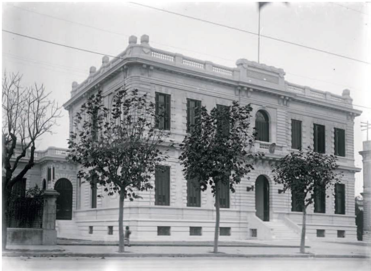
Figura 7. Hospital Militar 1922-1923.