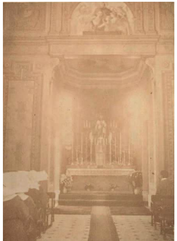
Figura 2. Hospital Militar vista interior de la Capilla.

Antes de finalizar sus estudios había actuado como dibujante en el proyecto y obra del Hospital Militar y proyectó la capilla de dicho edificio (figuras 2 y 3).