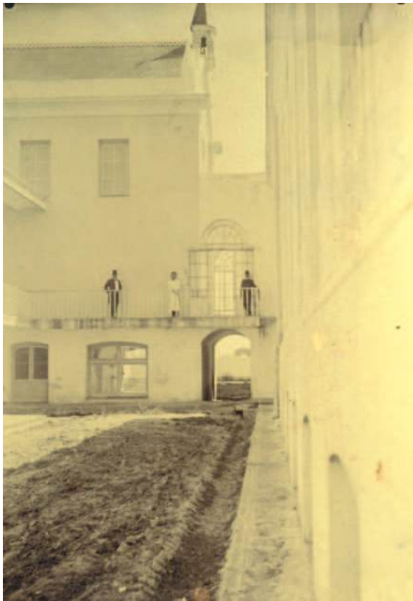
Figura 3. Hospital Militar vista exterior.